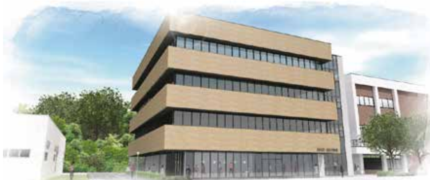
新データサイエンス学部棟 完成予想図 2024年3月竣工予定

第一段階は、これからの都市発展のカギを握る、IoT・グリーンニューディール・医療インフラと密接な関係を持つデータサイエンス分野への参入です。2024年4月に「データサイエンス学部(仮称・設置構想中)」を開設する予定で、そして第二段階として2025年4月には「看護学部(仮称・設置構想中)」を開設する予定です。両学部とも下関市が進めるスマートシティー推進事業との親和性が高く、卒業後も地域の発展に貢献する人材を育成する学部です。